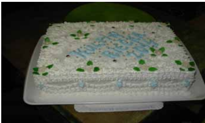
Na svadbe nechýbala chýrečná kulpínska biela doboška