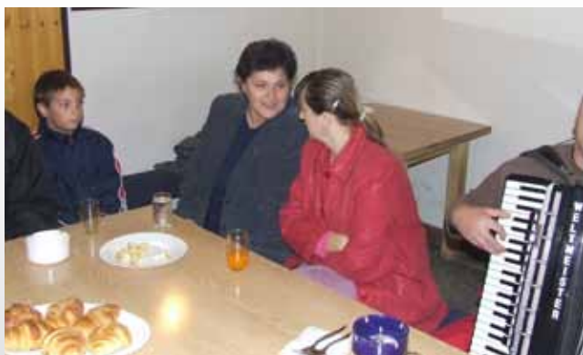
Posedenie na rybárskej chate v Kulpíne večer po podpísaní zmluvy 14. októbra 2006