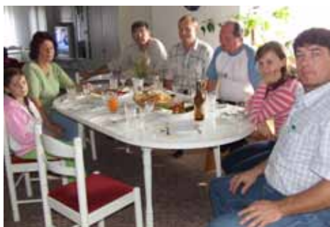
Pohostenie u Gažov v Kulpíne