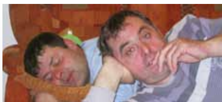
Gapo a Stury