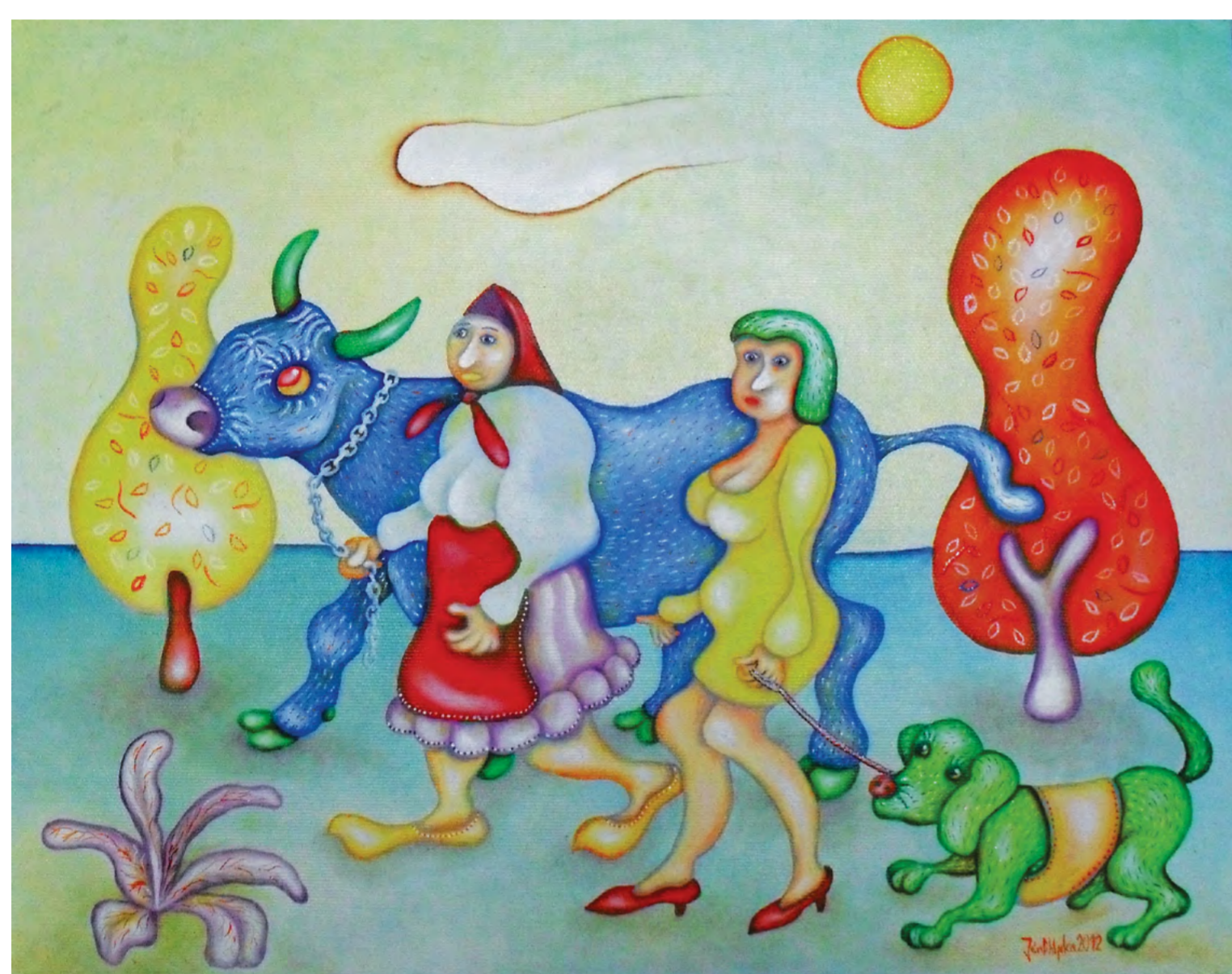
Matka a dcéra, olejomalba, 35 cm x 45 cm, 2012