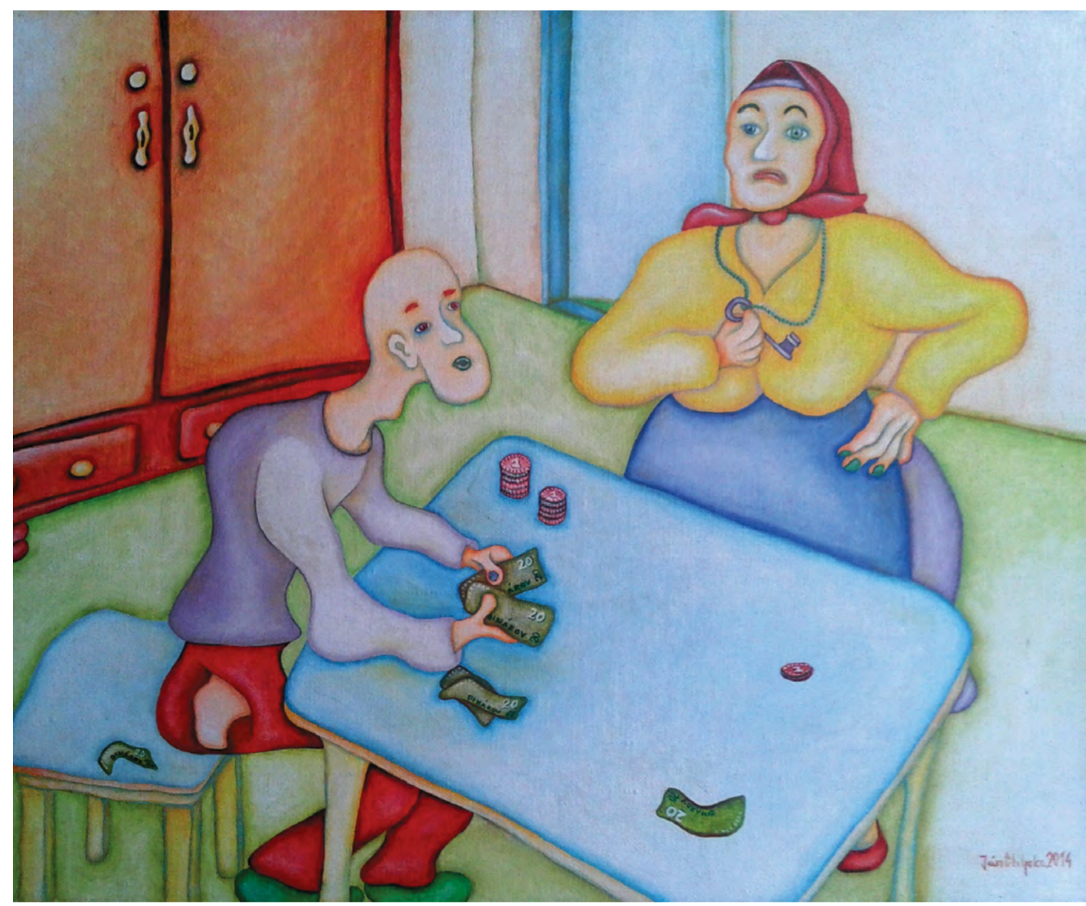
Slovenska sporitelna, olejomalba, 35 cm x 45 cm, 2015