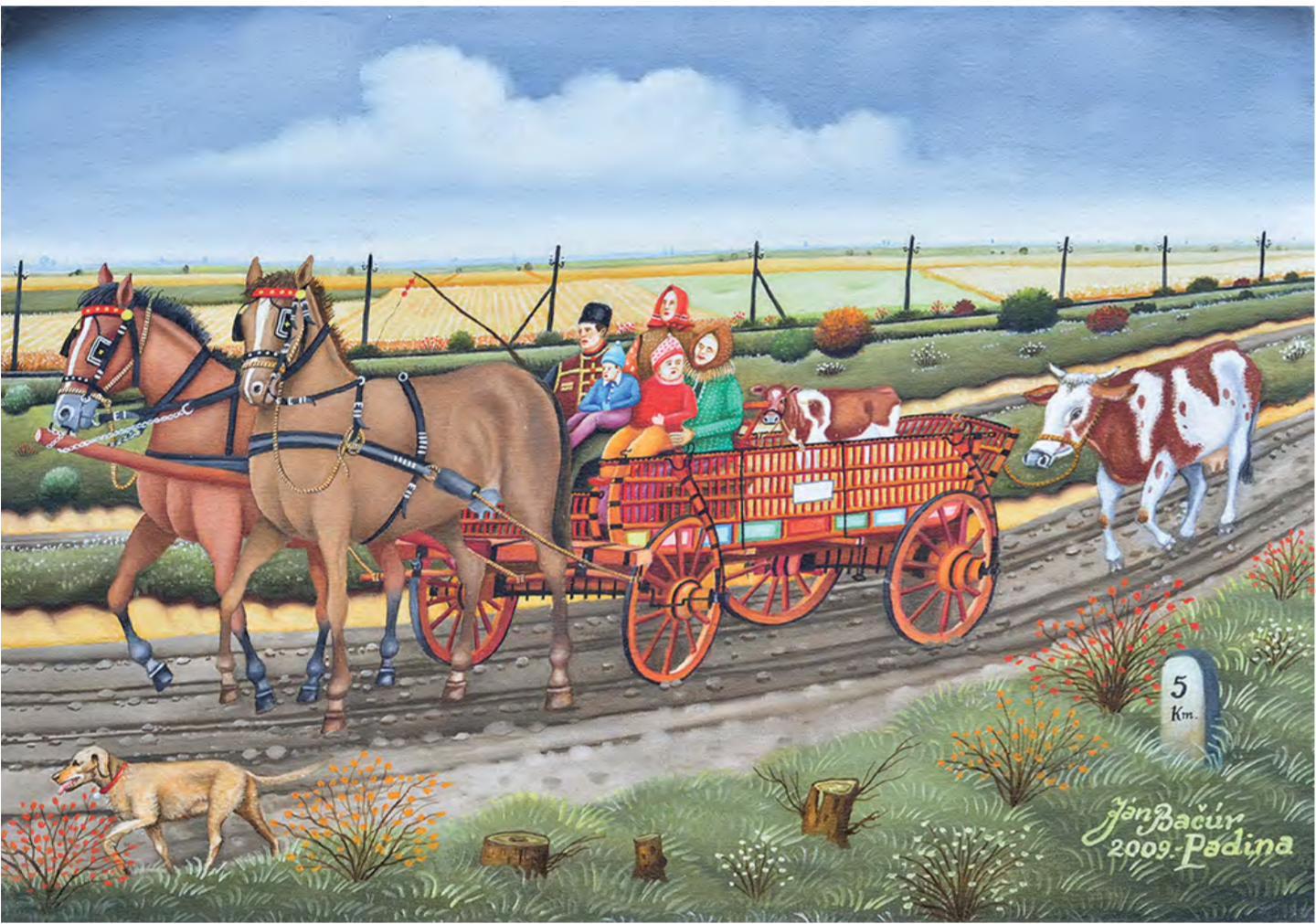
Babkov dom z roka 1894, olejomalba, 50 cm x 70 cm, 2015 rok

Ľudia chcú vidieť to, čo je už minulosť, ako vyzerala rodná dedina. Chcem zvečniť folklór a obyčaje v Padine. U mňa je všetko viac-menej autentické. Moje obrazy sú ako maľovaná fotodokumentácia. Nemaľoval som hneď portréty, lebo si myslím, že je to jedna seriózna maliarska disciplína. Trochu som robil portréty na výkone povinnej vojenskej služby. Keď som znovu začal maľovať v roku 1991, jeden novinár mi navrhol, aby som namaľoval portréty všetkých kovačických zakladateľov galérie. Už koncom roka 1992 som mal výstavu všetkých tých portrétov v Kovačici. Teraz po dvadsiatich rokoch som znovu usporiadal tú výstavu. Namaľoval som aj nových členov – všetkých ku dnešnému dňu.