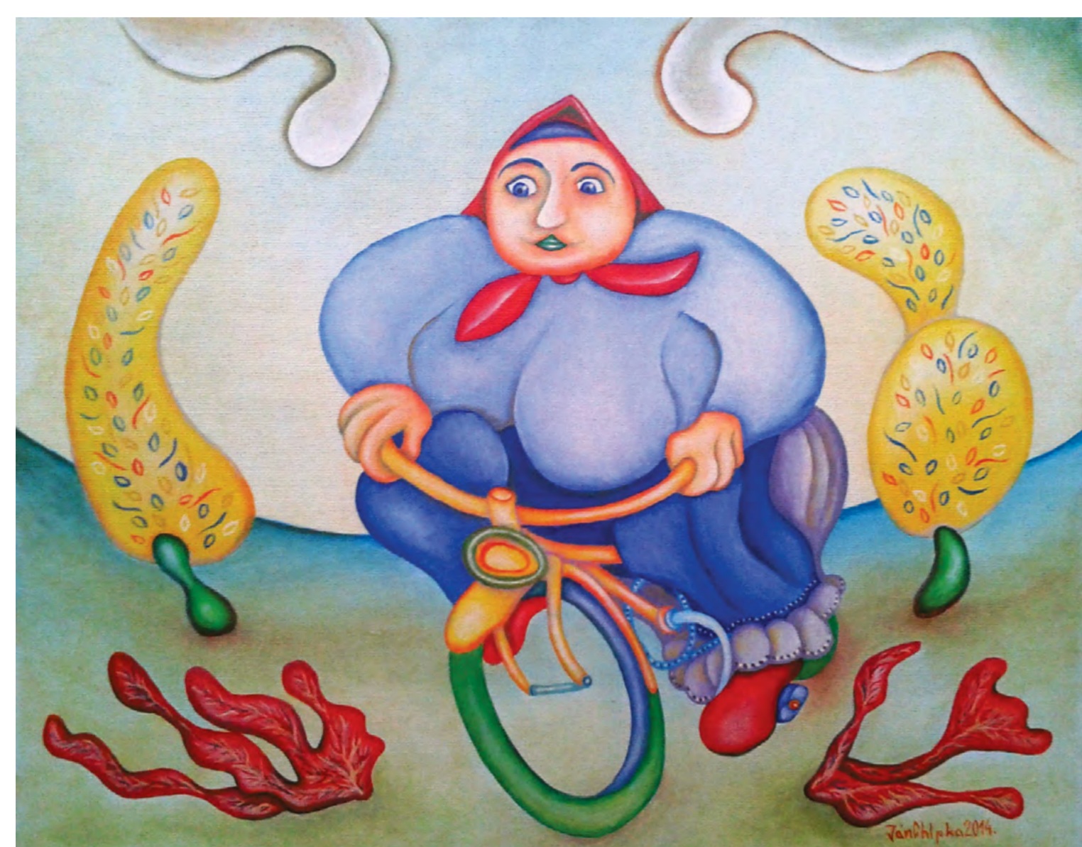
Babka na bicykle, olejomalba, 35 cm x 45 cm, 2015