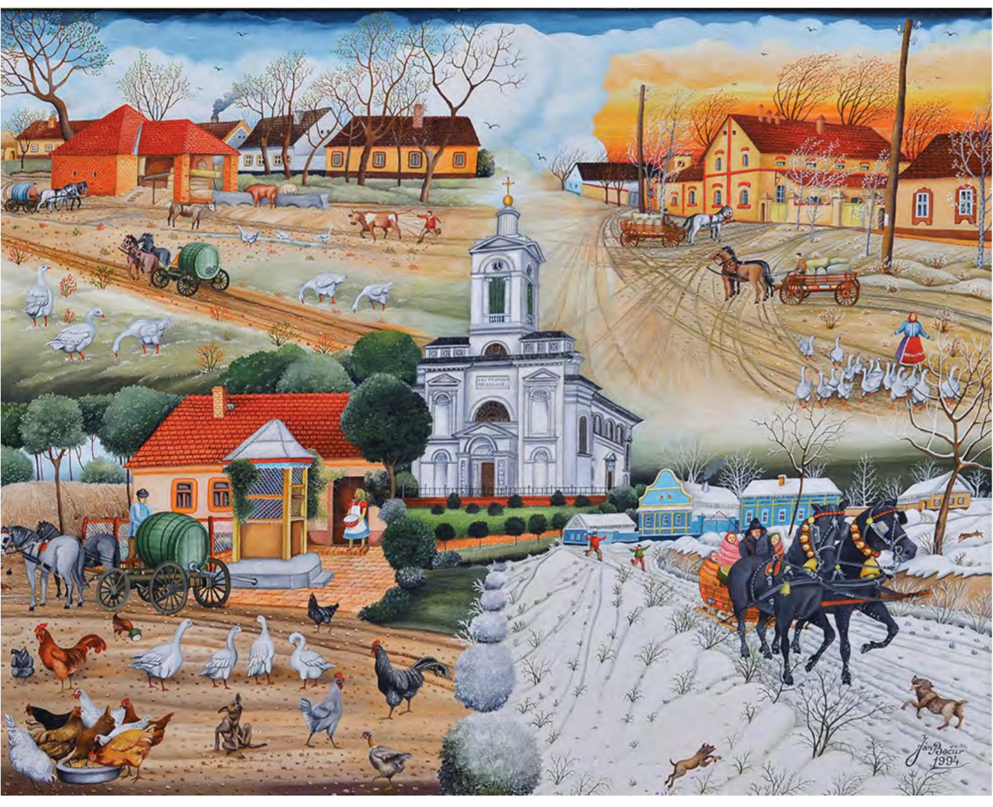
Babkov dom z roka 1894, olejomalba, 50 cm x 70 cm, 2015 rok