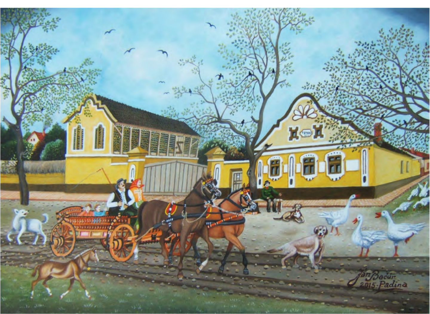
Babkov dom z roka 1894, olejomalba, 50 cm x 70 cm, 2015 rok

Rozhodol som sa, že si svoju monografiu zostavím sám. Mal som veľa napísaných textov o svojej práci. Písali o mne rôzni ľudia – novinári, historici umenia, celkovo dvadsaťdva rôznych autorov. Nemohol som nájsť sponzora. Hľadal som vydavateľstvo, peniaze.