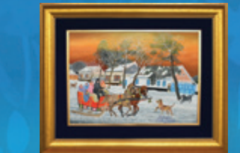
Ján Bačúr (1937)