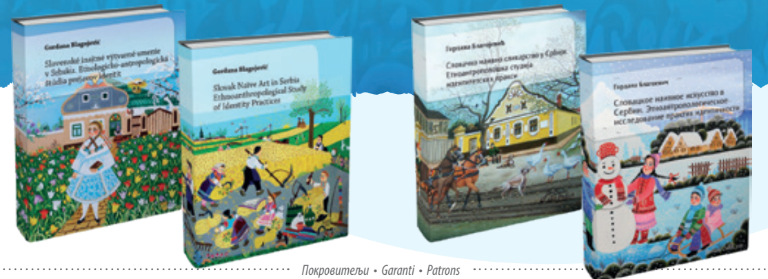
Покровитељи • Garanti • Patrons

220-year-old Kovacića (May 15, 1802 – May 15, 2022)