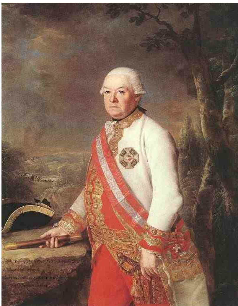
A. Hadík v čase, keď už bol aj maršalom.

Na Slovensku priezvisko Hadík, podľa dát z 1995. roku, už vôbec nejestvuje.